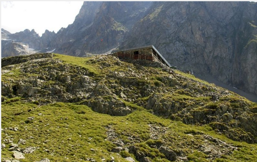
Refuge de l'Olan